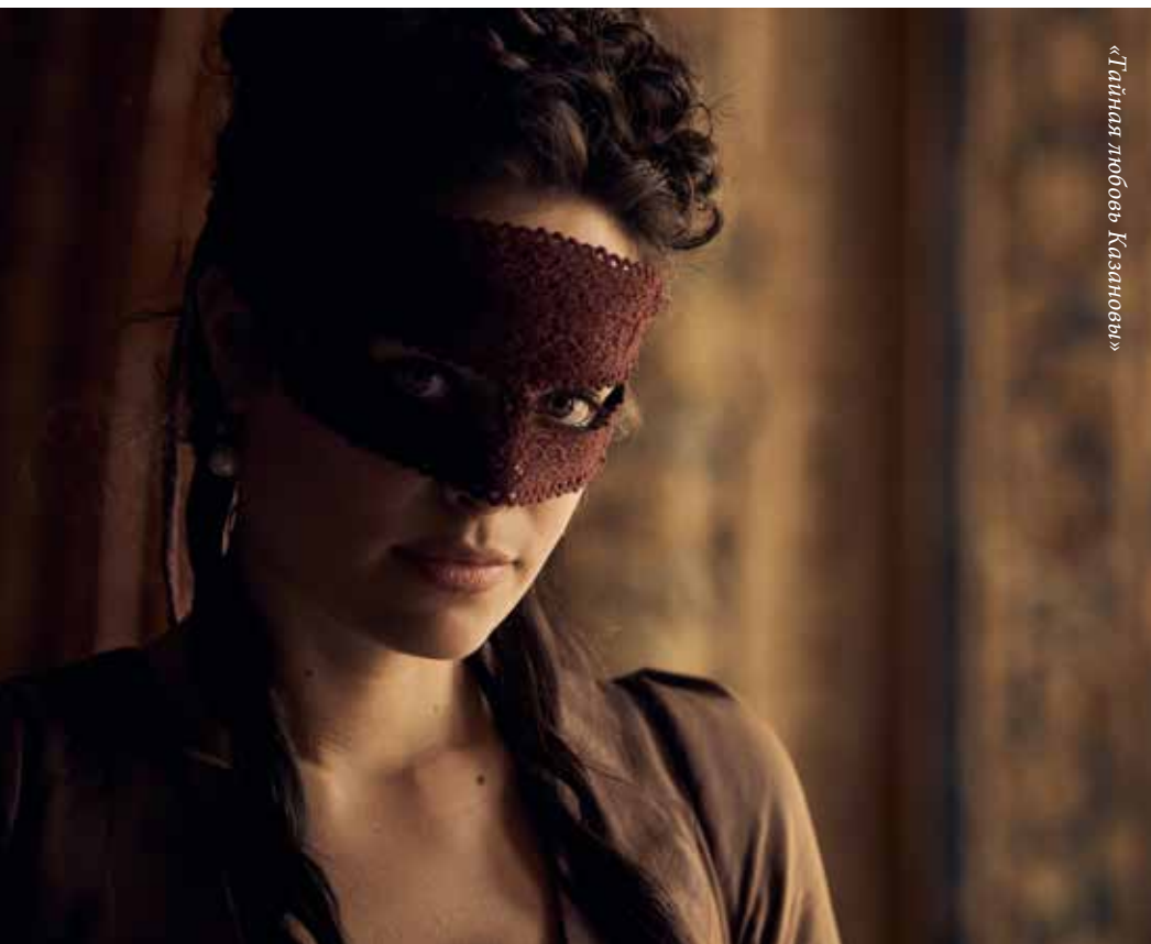
«Гайная любовь» Казановы»

сты, отлично зарекомендовавшие себя после мирового успеха семейных фильмов «Белль и Себастьян», «Птицы» и «Океаны». Фильм рассказывает о приключениях молодого олененка, окруженного лесными животными: его другом вороном, кроликом, енотом... Он открывает для себя мир природы и ее секреты. Но когда наступает осень, Бемби навсегда разлучают с его матерью. С тех пор молодому олененку приходится учиться жить самостоятельно. К счастью, он найдет верных друзей, с которыми отправится на встречу своей собственной судьбе. История Бемби повествует о первых годах жизни олененка и испытаниях, с которыми ему приходится сталкиваться в лесу... Эта история учит нас тому, что мы всегда должны сохранять надежду. С самых первых дней своей жизни молодой олененок восхищается всем, что его окружает. «Дружба, уважение, самопознание найдут отражение в фильме, на-