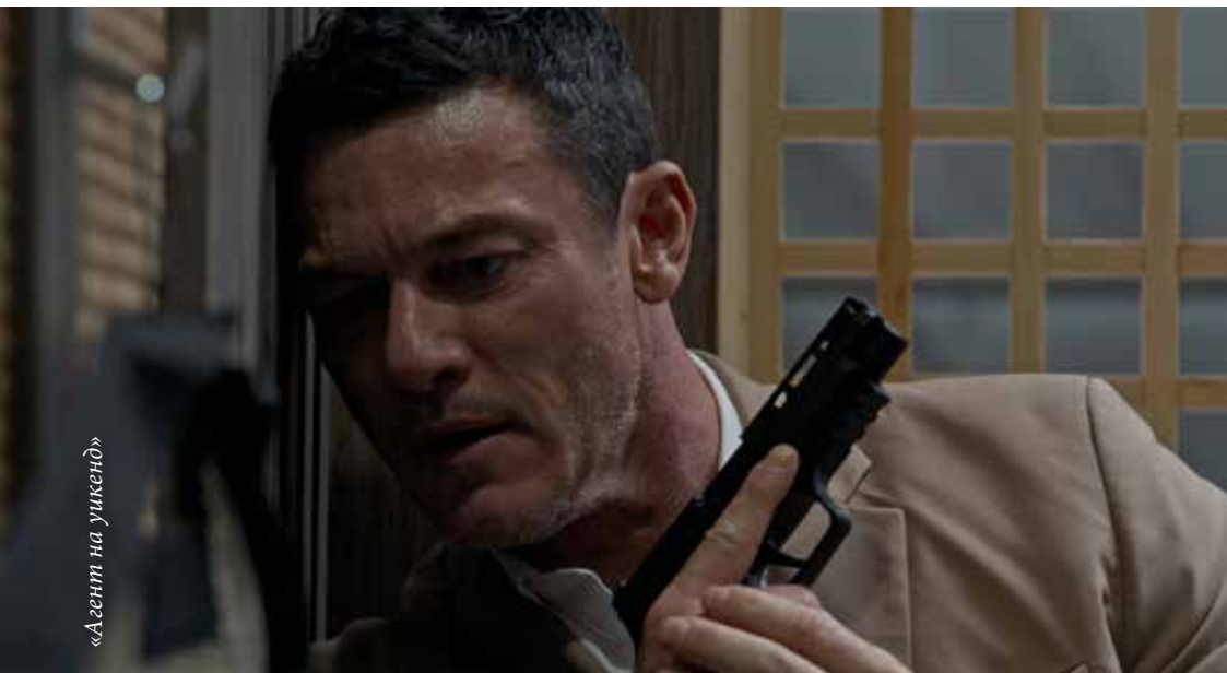
«Агент на уикенд»

Он — спецгент, для которого не бывает невыполнимых миссий. Она — лучший перевозчик на службе преступного синдиката. Судьба сталкивает бывших любовников во время очередного задания, где им предстоит обнаружить, что сложнее, чем выжить, только... не влюбиться друг в друга снова. Главную роль в комедийном экшене «Агент на уикенд» исполнил звезда культовых франшиз «Хоббит» и «Форсаж» Люк Эванс. В фильме также снимались Гвэй Лунь Мэй («Секрет», «Рай океана») и Сон Ган («Форсаж», «Оби-Ван Кеноби»). Автором сценария и продюсером выступил создатель франшиз «Заложница», «Перевозчик» и «Такси» Люк Бессон. «Агент на уикенд» снимался в живописных локациях Тайбэя, что добавило фильму визуального разнообразия: от современных небоскребов до густых лесов. Команда столкнулась с рядом трудностей, таких, как съемки в условиях жаркого и влажного климата. Впечатляющие