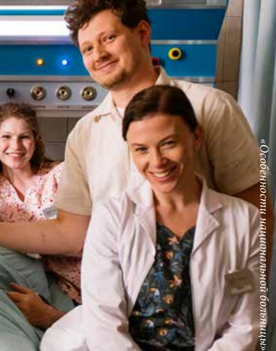
«Особенности национальной больницы»