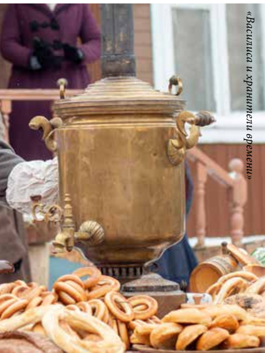
«Василиса и хранители времени»

маялся у Джонатана Глейзера в «Побудь в моей шкуре»). Не будем спойлерить, просто скажем, что их соперничество развернется на сцене — актерство герой так и не бросит. Режиссер фильма «Другой человек» Аарон Шимберг создает удивительный микс из отсылок к лучшим творениям Дэвида Кроненберга и Вуди Аллена. Эдвард то кровавыми шматами сдирает с себя кожу, то бродит по Нью-Йорку в очках и панаме, попадая в неловкие ситуации. Фильм стильный, по-хорошему причудливый, но совсем не такой глубокий, как хотелось бы автору, в финале сводящему все идеи к простой мысли о том, что можно поменять лицо, но нельзя поменять личность. На обсуждении фильма «Другой человек» на открытии фестиваля New Directors/New Films в Нью-Йорке Себастиан Стэн вспоминал, как он впервые прочитал сценарий: «Прекрасно написанный, он рассказывал удивительную историю, совершенно непредсказуемую. Все его герои казались очень настоящими, живущими своей собственной жизнью. А как актер ты, конечно, стараешься выбирать проекты, которые бросают тебе вызов, где ты можешь сыграть что-то совершенно новое».