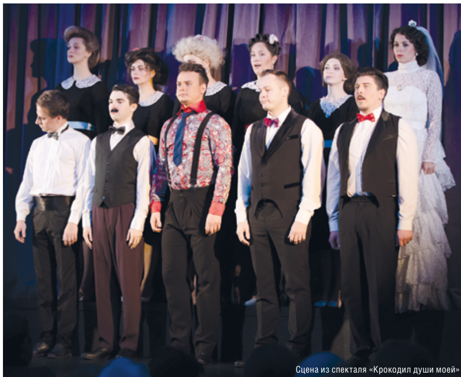
Сцена из спектакля «Крокодил души моей»

Жанр миниатюр уютно чувствует себя на прославленной сцене. Он не только задает динамику действию, культивирует сатиру и юмор, но и позволяет каждому артисту выйти на авансцену и прожить историю главного персонажа. Сегодня стать одним из героев рассказов Шукшина, завтра примерить костюм героя из рассказов Антоши Чехонте в спектакле «Крокодил души моей».