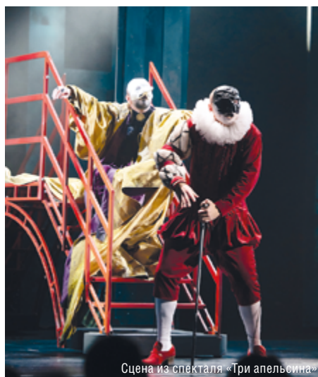
Сцена из спектакля «Три апельсина»