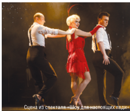
Сцена из спектакля «Шоу для настоящих леди»