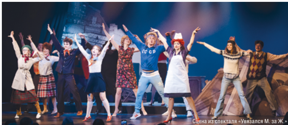
Сцена из спектакля «Увязался М. за Ж.»