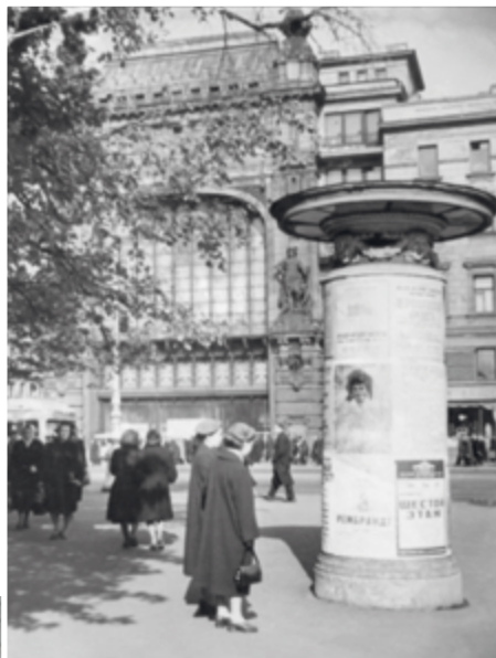
Фотографии из архива ДТЗК

В октябре 1944 года при управлении по делам искусств была организована Дирекция театральных касс с районными филиалами. Под театральные кассы были отведены помещения по шести адресам. К 1948 году в Ленинграде работало уже шестнадцать театральных касс. В августе 1964 года решением Исполкома Ленинградского горсовета ДТК была реорганизована в Дирекцию театрально-концертных и спортивно-зрелищных касс. К концу того же года сеть театральных касс-киосков значительно расширилась: киоски работали не только во всех районах города, но и на железнодорожных вокзалах, станциях метро, в аэропорту, гостиницах, Морском порту.