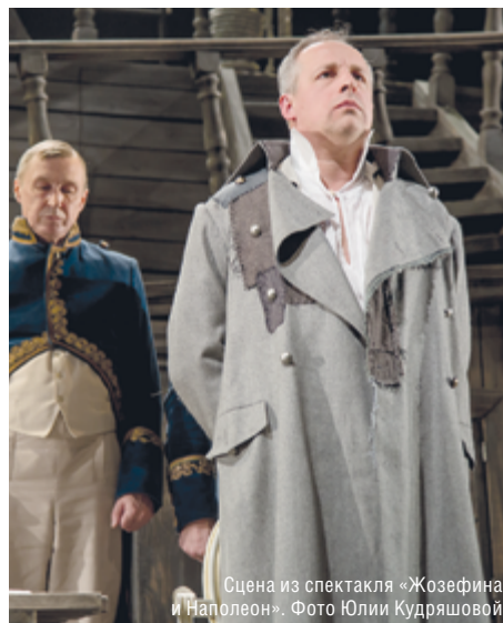
Сцена из спектакля «Жозефина и Наполеон».

– Есть работа, которой я горжусь. Это совершенно восхитительный роман «Вторая жизнь Уве» Ф. Бакмана, шведского писателя. Я с большим трепетом записывал этот текст, и удалось, мне кажется, достичь каких-то актерских высот в этой аудиокниге. Иной раз слушаешь: говорящий робот, который перечисляет текст по словам. Ей-богу, нейросеть лучше бы справилась.