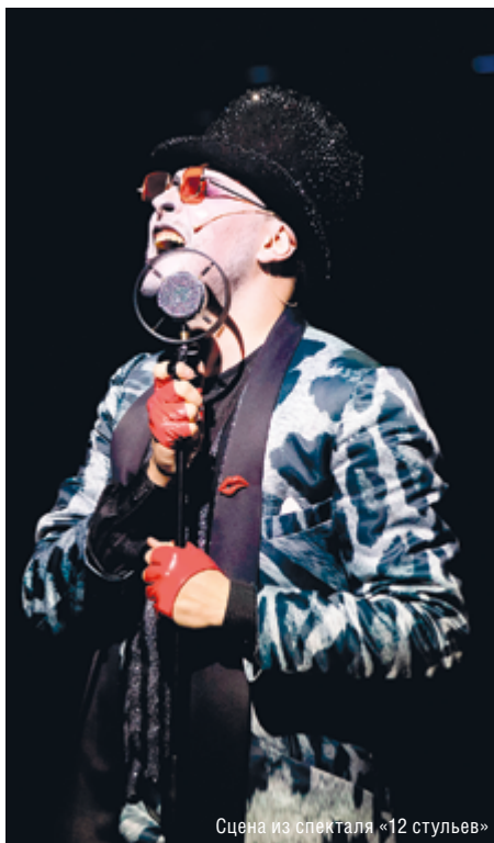
Сцена из спектакля «12 стульев»

«Гальчата» умеют соединить гротеск, бытовую драму, капустник, эксцентрику, лирическую комедию, сатиру, фарс, эстраду в цельное произведение искусства. Они научились бережно сохранять классику, задавая ей современный пульс. Со времен Аркадия Райкина пространство на Большой Конюшенной известно как место, где начинали свое творческое парение самые популярные артисты страны. Ученики Юрия Гальцева продолжают эту традицию, они стали достойными наследниками легендарного Театра Эстрады и миниатюр. Который навсегда останется символом Петербурга, символом страны, символом эпохи.