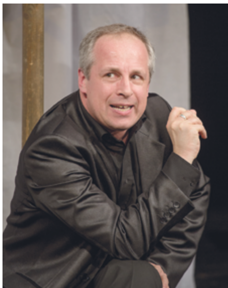
В спектакле «В полночный час...».

– Своими библиотечными открытиями, вы, как богатством, делитесь со зрителями Молодежного театра на Фонтанке. При создании моноспектакля «В полночный час, в эпоху Возрождения» Вам пришлось погрузиться в сокровищницу Публичной библиотеки. – Мы достаем для зрителя такие тексты, до которых они сами, может быть, и никогда