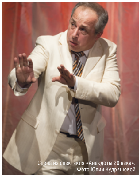
Сцена из спектакля «Анекдоты 20 века».

– Своими библиотечными открытиями, вы, как богатством, делитесь со зрителями Молодежного театра на Фонтанке. При создании моноспектакля «В полночный час, в эпоху Возрождения» Вам пришлось погрузиться в сокровищницу Публичной библиотеки. – Мы достаем для зрителя такие тексты, до которых они сами, может быть, и никогда